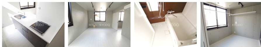
間取りの「S」はサービスルーム(納戸)です。