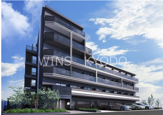
外観完成予想CGは図面を基に描き起こしたもので、外観・外構等は多少異なる場合があります

防犯カメラ 外壁タイル張り 駅まで平坦 平坦地 高層階 最上階 上階無し 2F以上 オートロック モニタ付オートロック ダブルロック ディンプルキー ダブルディンプルキー 角住戸 通風良好