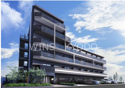
外観完成予想CGは図面を基に描き起こしたもので、外観・外構等は多少異なる場合があります

防犯カメラ 外壁タイル張り 駅まで平坦 平坦地 2F以上 オートロック モニタ付オートロック ダブルロック ディンプルキー ー ダブルディンプルキー 角住戸 通風良好